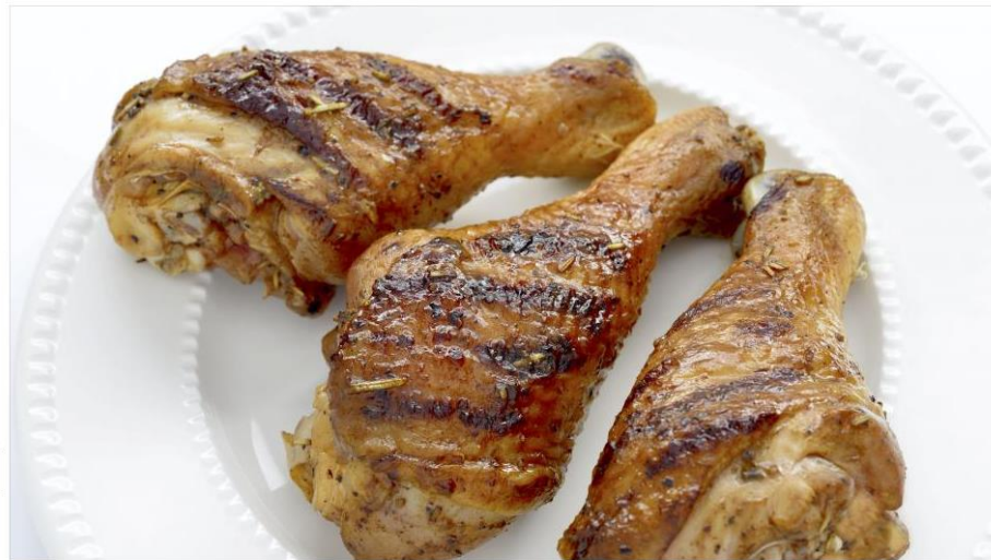
En stor del af foodservicesektoren importerer kylling fra bl.a. Thailand og Brasilien, men hos hotelkæden Scandic skal det være slut.

Del Danmarks største hotelkæde vil fra udgangen af 2019 kun servere dansk kylling i sine restauranter. f af 2019 kun servere dansk kylling i sine restauranter. t af 2019 kun servere dansk kylling i sine restauranter. in af 2019 kun servere dansk kylling i sine restauranter. ✉ Hotelkæden Scandic, der er den største i Danmark, har besluttet, at kædens