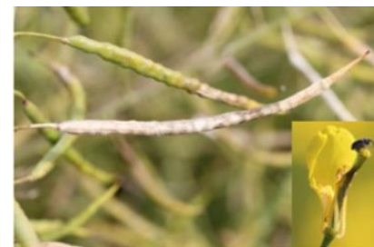
Skulpesnudebiller: nådmodne skulper