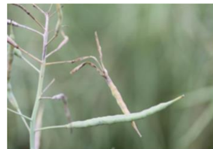
Skulpegalmyg: opsprungne skulper